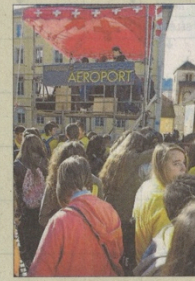
L'aéroport avec sa foule, son effervescence... et ses retards. Quand la fiction rejoint la réalité.

son de quelques soucis techniques. Ne parlions-nous pas d'un véritable aéroport?