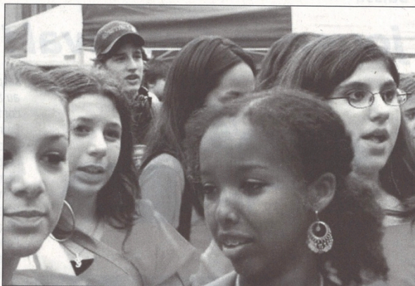
Ethnopoly-Sainti 2015: un projet culturel passionnant.

Au terme d'une rencontre qui durera 15 à 20 minutes, les élèves pourront gagner des points attribués par les personnes visitées qui évalueront l'échange. Plus de 30 familles, habitants de la localité issus de toutes